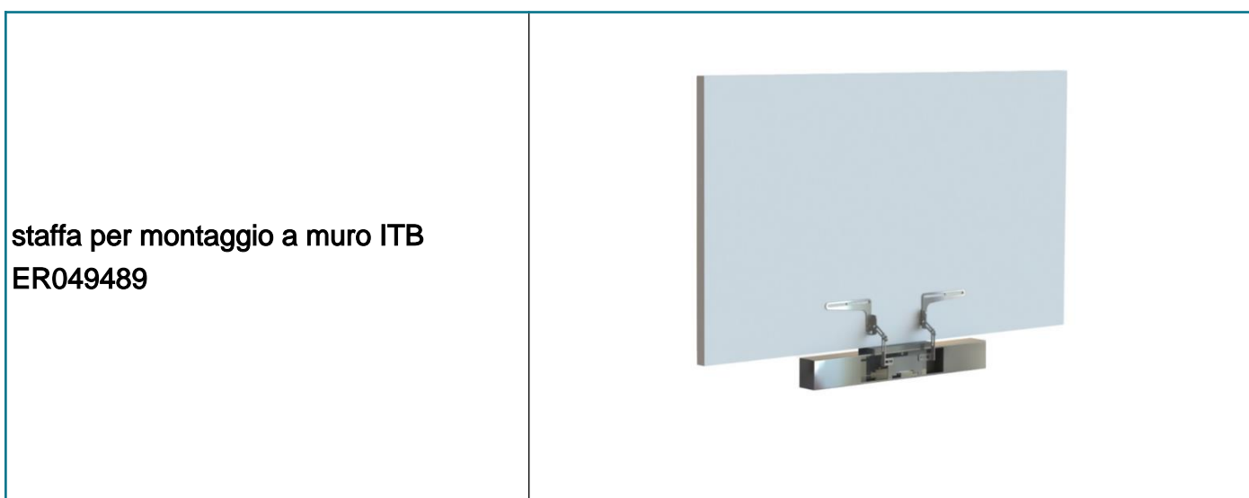
staffa per montaggio a muro ITB ER049489