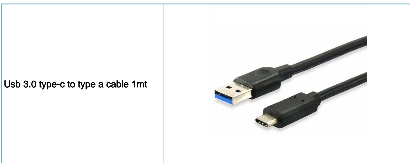
Usb 3.0 type-c to type a cable 1mt